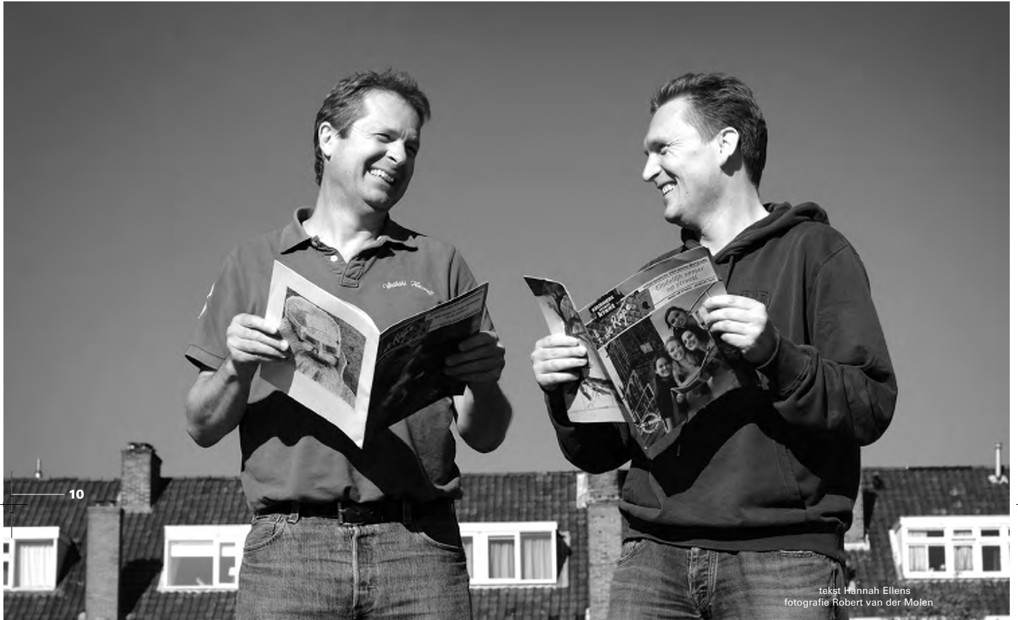
tekst Hannah Ellens

Een terugblik op de ontstaansgeschiedenis